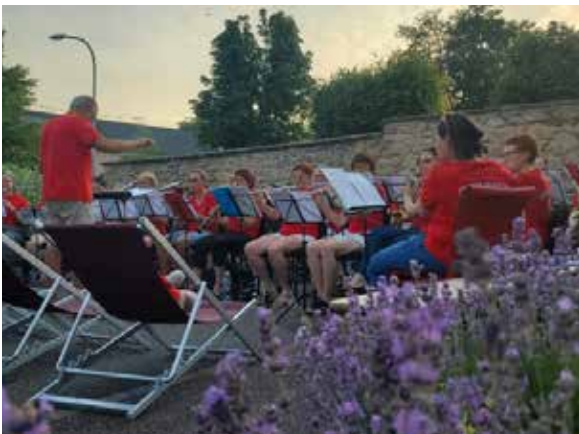
Concert Dorthisla Berrwiller 13 juin