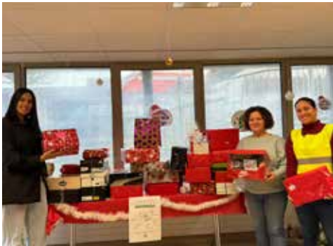
Une vingtaine de Boîtes de Noël à destination d'étudiants en précarité ont été confectionnées par les membres du BCBS