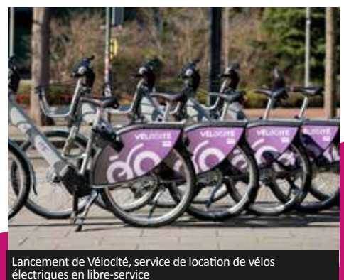
Lancement de Vélocité, service de location de vélos électriques en libre-service