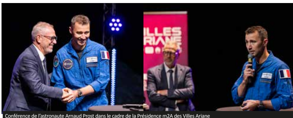
Conférence de l'astronaute Arnaud Prost dans le cadre de la Présidence m2A des Villes Ariane

Enfin, sur le plan de l'attractivité touristique, l'ouverture de l'espace « Horizon Afrique » au Parc Zoologique & Botanique de Mulhouse, avec plus de 60 espèces, aura marqué une étape importante et stratégique pour le rayonnement de tout le territoire, tant au niveau national qu'international.