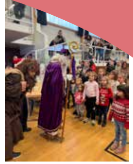
On l'attendait, il est venu... mais pas tout seul!