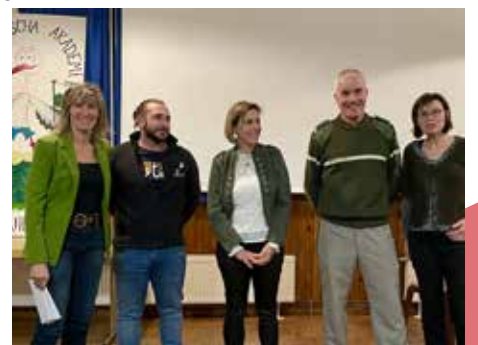
Brigade verte - photographes animaliers