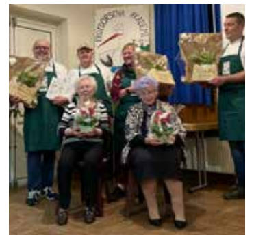
Nos 3 restaurateurs du village