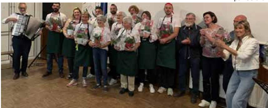
Les acteurs de notre comité