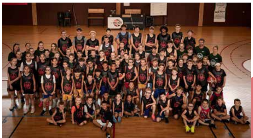
Le douzième stage d'été du BCBS a réuni près de 120 licencié(e)s repart(i)e(s) sur deux sessions

et sur Instagram bc Berrwillerstaffeldelden