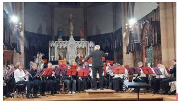
Concert à Willer-sur-Thur, 30 novembre