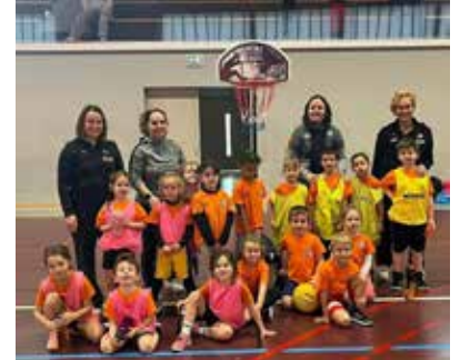
Les U7 au plateau de la Hardt