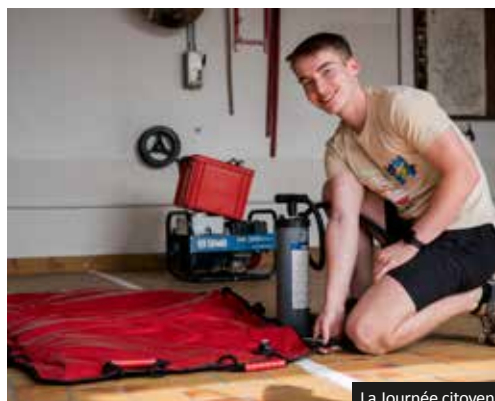
La Journée citoyenne à Berrwiller