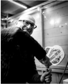
Un président en pleine action