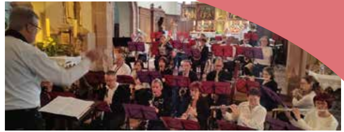
Concert des Rameaux Wattwiller, 13 avril

Merci de votre présence et soutien tout au long de l'année, et vive la musique... vivante, en direct lors de nos prestations !