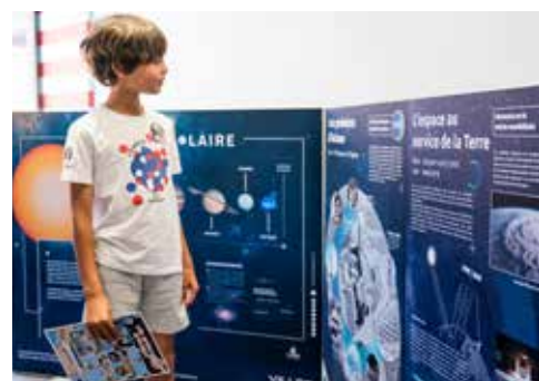
Exposition pédagogique dans le cadre de la Présidence m2A de la Communauté des Villes Ariane