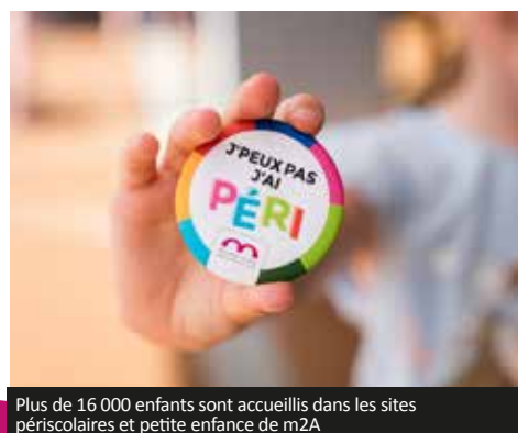
Plus de 16 000 enfants sont accueillis dans les sites périscolaires et petite enfance de m2A