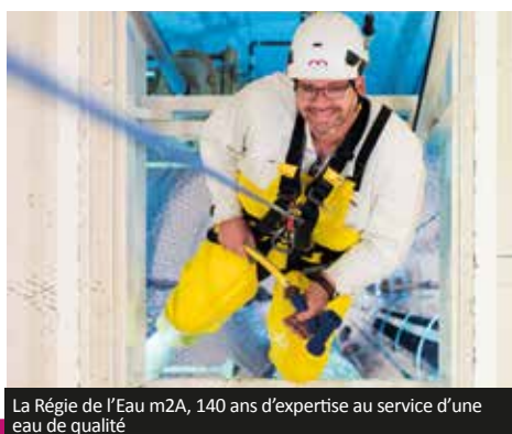
La Régie de l'Eau m2A, 140 ans d'expertise au service d'une eau de qualité