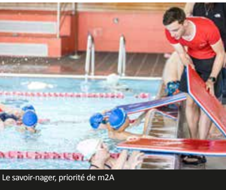
Le savoir-nager, priorité de m2A