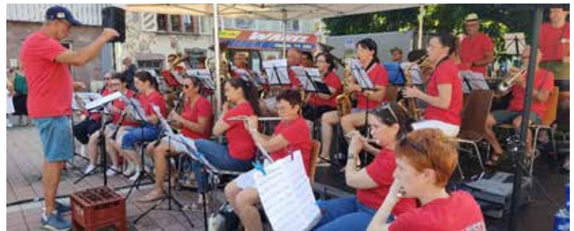
Fête de la Musique à Thann 21 juin