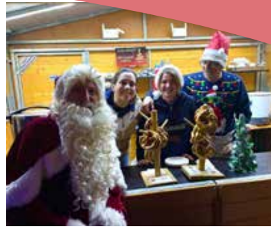
Le Berr'Noël a rendu visite aux chalets du BCBS