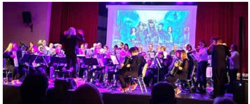
Concert avec Rouff' Acc orchestra, salle des fêtes de Rouffach, 4 octobre