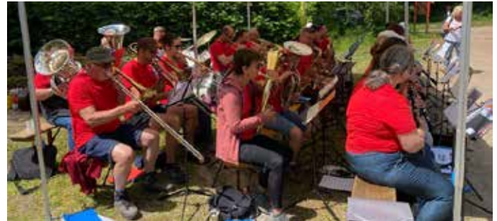
Marche Populaire Berrwiller 18 mai