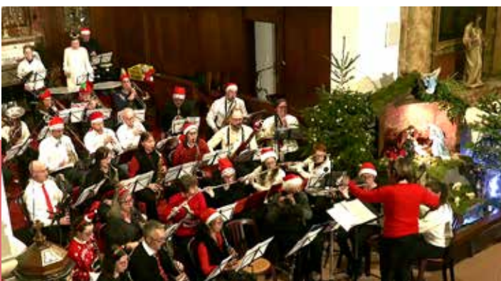
Berr'Noël, 19 décembre