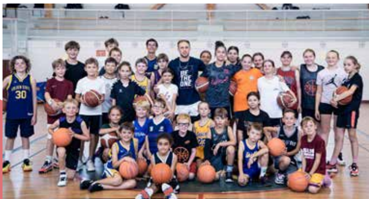
Une rencontre inspirante avec Ludovic Beyhurst basketteur professionnel pour les jeunes du BCBS