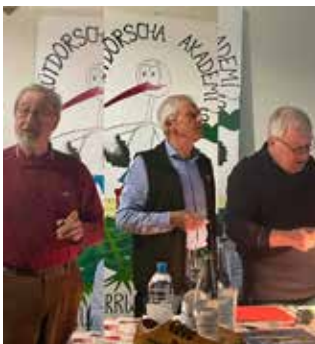
Histoire et anecdotes