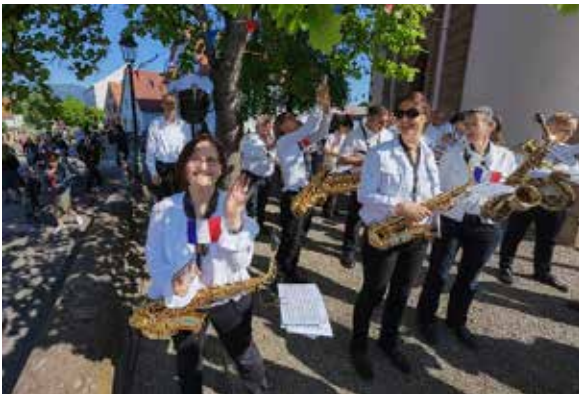
Berrwiller, 80 ans de la Libération et 8 mai