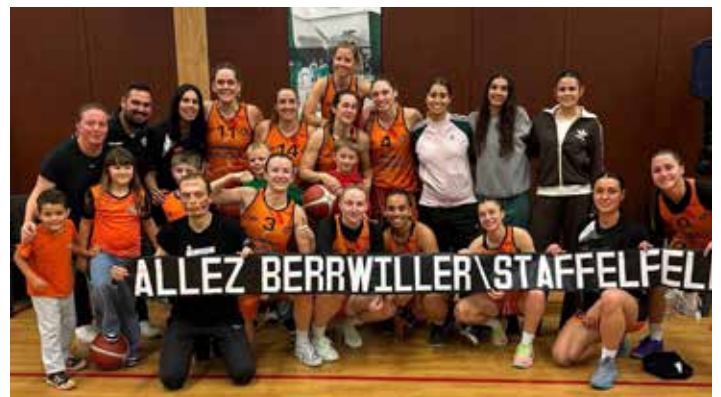
Objectif maintien pour les SF1 en Nationale 3