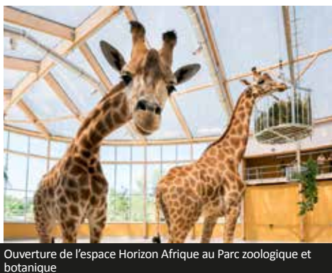
Ouverture de l'espace Horizon Afrique au Parc zoologique et botanique

Plus d'infos et de vidéos sur les actions quotidiennes de Mulhouse Alsace Agglomération (m2A) : m2A.fr et sur les réseaux sociaux m2A